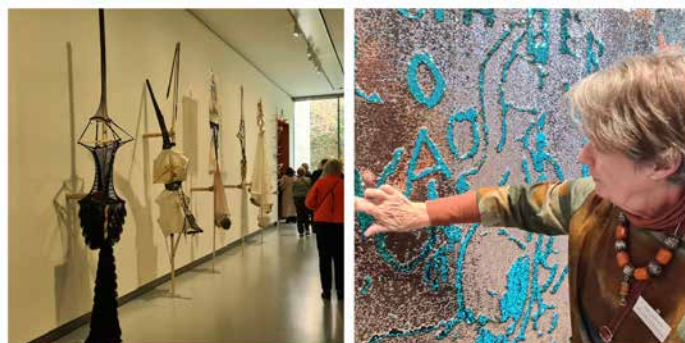
Tentoonstelling Lara Schnitger