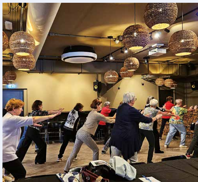
Workshop Tai Chi