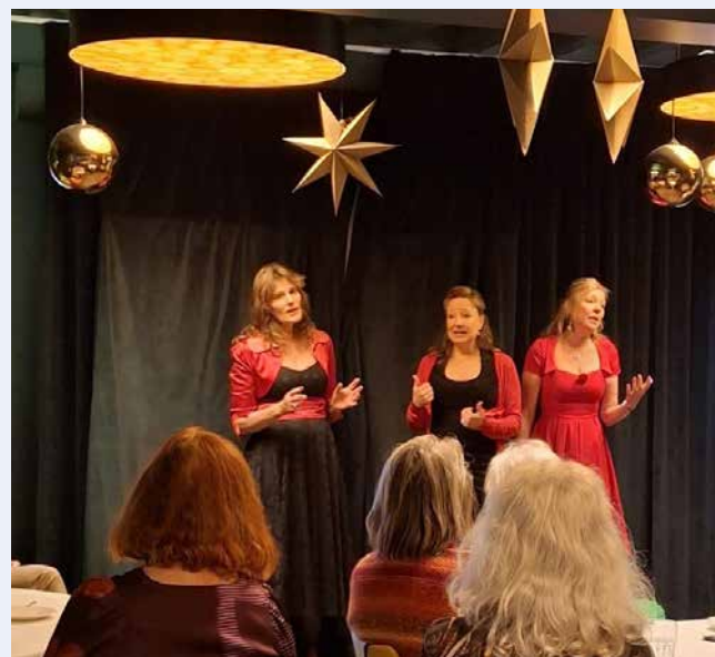
Het optreden van Bel Ami