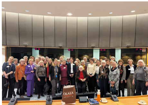
Λ boven: Busreis naar Brussel