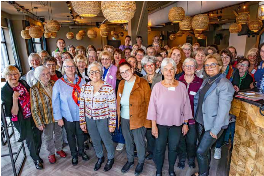
Groepsfoto van bezoekers van de DACH-nl bijeenkomst.