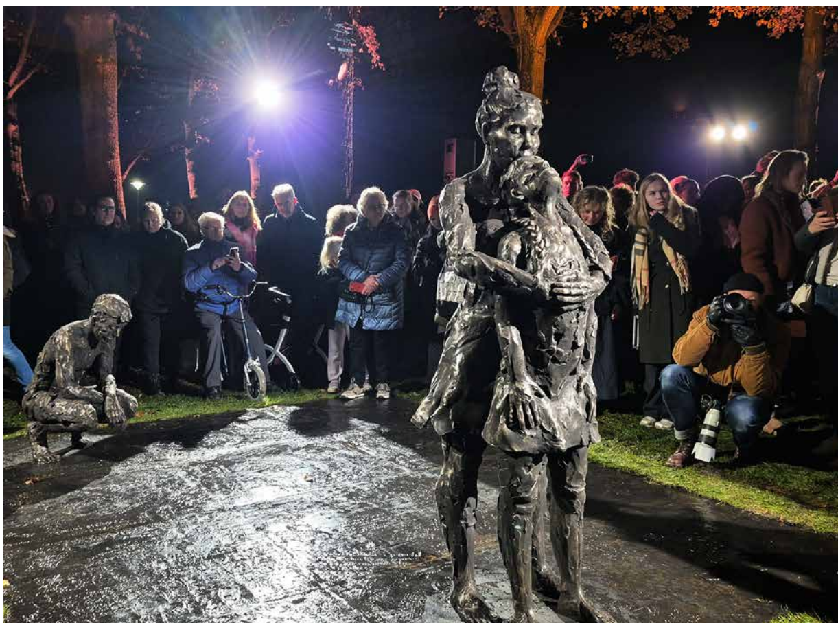
Onthulling Nationaal monument tegen seksueel geweld