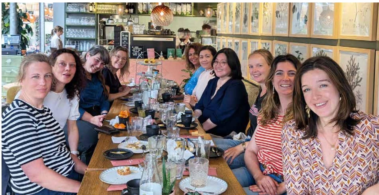
Jongerenlunch in Grand Café Hortus te Leiden