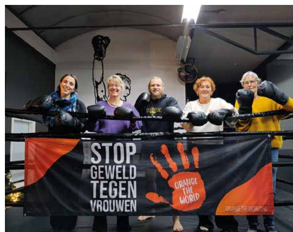
Voor Orange the World organiseerde afdeling Zwolle een gratis boksles voor meiden van 14 tot 18 jaar.

Vanuit het hoofdbestuur vervult de portefeuillehouder Maatschappelijke Betrokkenheid een coördinerende rol. Ook dit jaar hebben vele VVAO-afdelingen zich weer ingezet om aandacht te vragen voor een veilige toekomst en gelijke rechten. Als individuele afdeling, soms regionaal, maar ook vaak met andere (vrouwen)