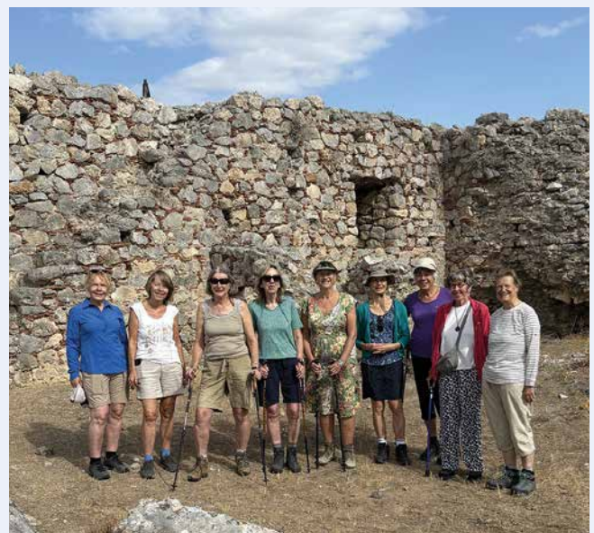
Lange afstandswandelkring in Griekenland